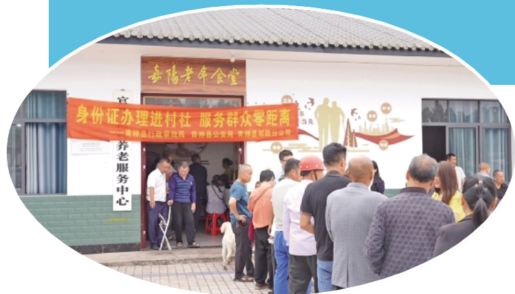
工作人员在罗波乡官山村开展上门办理身份证服务

政务服务的落脚点，从来都藏在群众与企业的细碎诉求里。近年来，四川省眉山市青神县跳出单一窗口服务的传统思维，以跨部门协同改革为抓手，向内精简办事流程，向外延伸服务触角。一边把身份证办理、民生证明开具等高频民生事项搬到村组院落，破解偏远群众办事“进城远、跑路难”的堵点；一边瞄准园区企业产权办理痛点，重构并联审批权责体系，破除部门数据壁垒。从田间地头的上门办证，到产业园区的一站审批，青神县始终坚持以“民生需求在哪、服务延伸到哪、企业难点在哪、改革攻坚到哪”，用微改革回应大期盼，推动政务服务从“被动受理”转向“主动靠前”，让惠民利企举措落地到基层末梢。