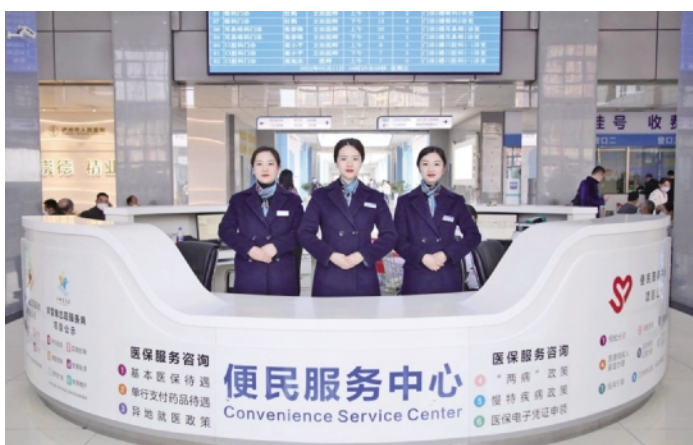
门诊大厅便民服务中心

在可负担性方面，该院认真落实医疗保障和价格管理制度，着力打造15分钟医保服务圈标杆——医保服务站，医保服务站整合优化办理的事项有医保电子凭证申领、异地急诊、门诊特殊疾病认定、门诊慢病认定、单行支付药品病种认定及结算等业务。