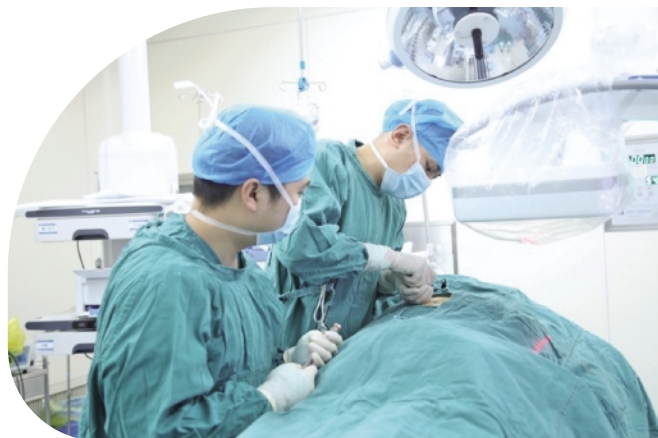
在建省级临床重点专科（“川渝共建”临床重点专科）——神经脊柱外科

目前，医院已形成“一区两区一托管”格局，开放床位1332张。沙茜院区以综合发展医疗、教学、科研、预防为主要功能；市府路院区以老年病、慢性病等特色专科为主要功能；托管的泸州市传染病医院以突发公共卫生事件救治为主要功能。