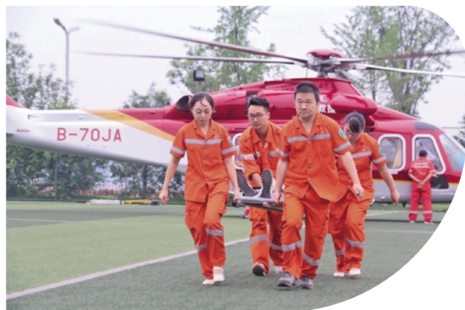
2020年1月18日泸州市人民医院开通直升机空中救援