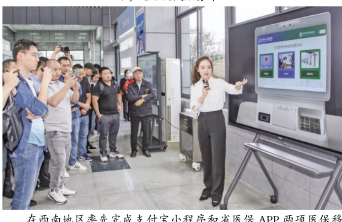
在西南地区率先完成支付宝小程序和省医保APP两项医保移动支付功能建设