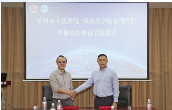
泸州市人民医院-川南医学转化研究院科研合作协议签约仪式

在“强融合”上，为促进医防融合事业的发展，泸州市人民医院作为牵头单位，率先在省内成立了泸州市医学会医防融合专业委员会。以慢病管理为重点，打造“医防融合泸州模式”。这是医院在新质生产力引领下的一次大胆探索、具体实践，是医疗、预防等生产要素的创新性配置，促进医疗服务模式拓展及转型。