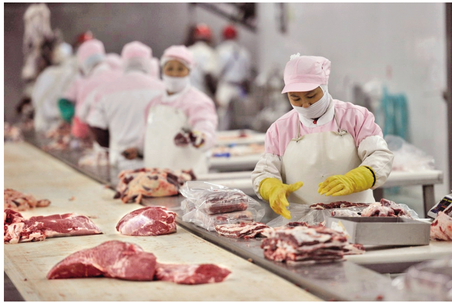
重庆恒都农业集团有限公司牛肉精深加工

化汽车配件生产项目。目前,丰都工业园区共招引优质项目13个,其中百亿级项目2个,20亿级项目1个,10亿级项目2个,亿级项目6个,实现合同引资421.03亿元。