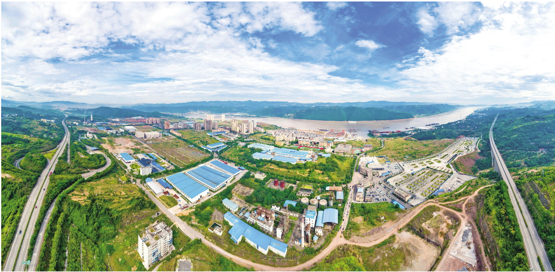
重庆丰都工业园区全景

“唯改革者进,唯创新者强,唯改革创新者胜。”下一步,该县将全面贯彻落实市委、市政府和县委、县政府安排部署,持续推进园区改革攻坚,通过加速管理体系重构,升