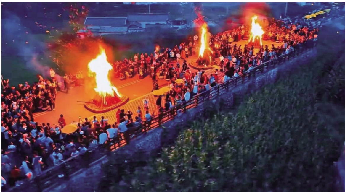
□勒勒阿呷 李荣伟 高明山 本报记者 李鹏飞