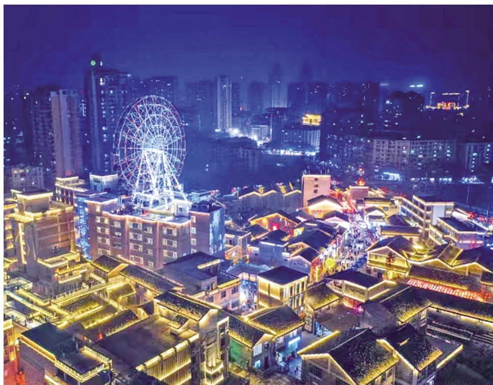
南川东街

替外延式整合、“精细化更新”代替粗放式拆改、“可持续发展”代替一次性建设原则,成为南川文旅发展“新引擎”。南川东街先后荣膺国家级夜间文化和旅游消费集聚区、国家旅游休闲街区等称号,一举改写了南川无重庆市级新地标的历史。