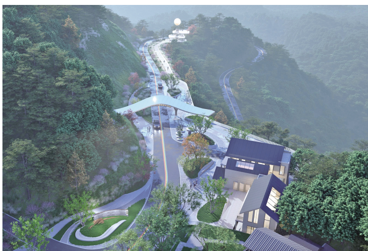
明月山天香旅游度假区北主入口效果图