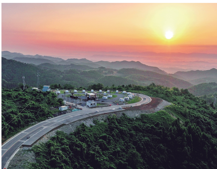
闲云茗居房车露营地