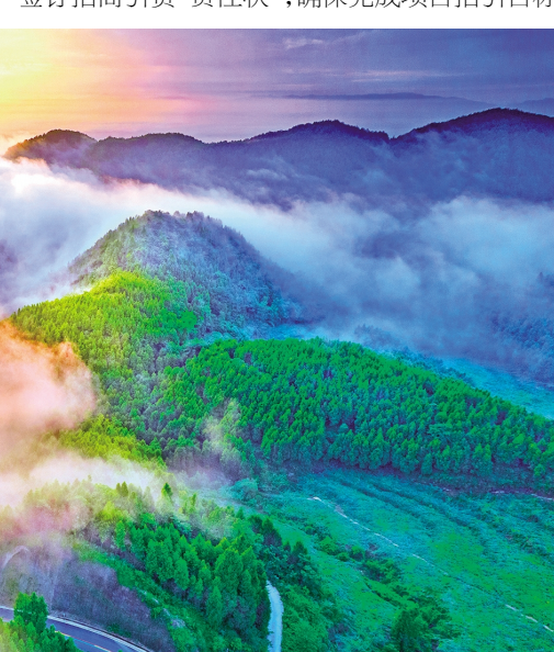
明月山风景

同时，积极制定年度招商行动实施方案，框定招商引资“时间表”，绘制招商引资“路线图”，签订招商引资“责任状”，确保完成项目招引目标