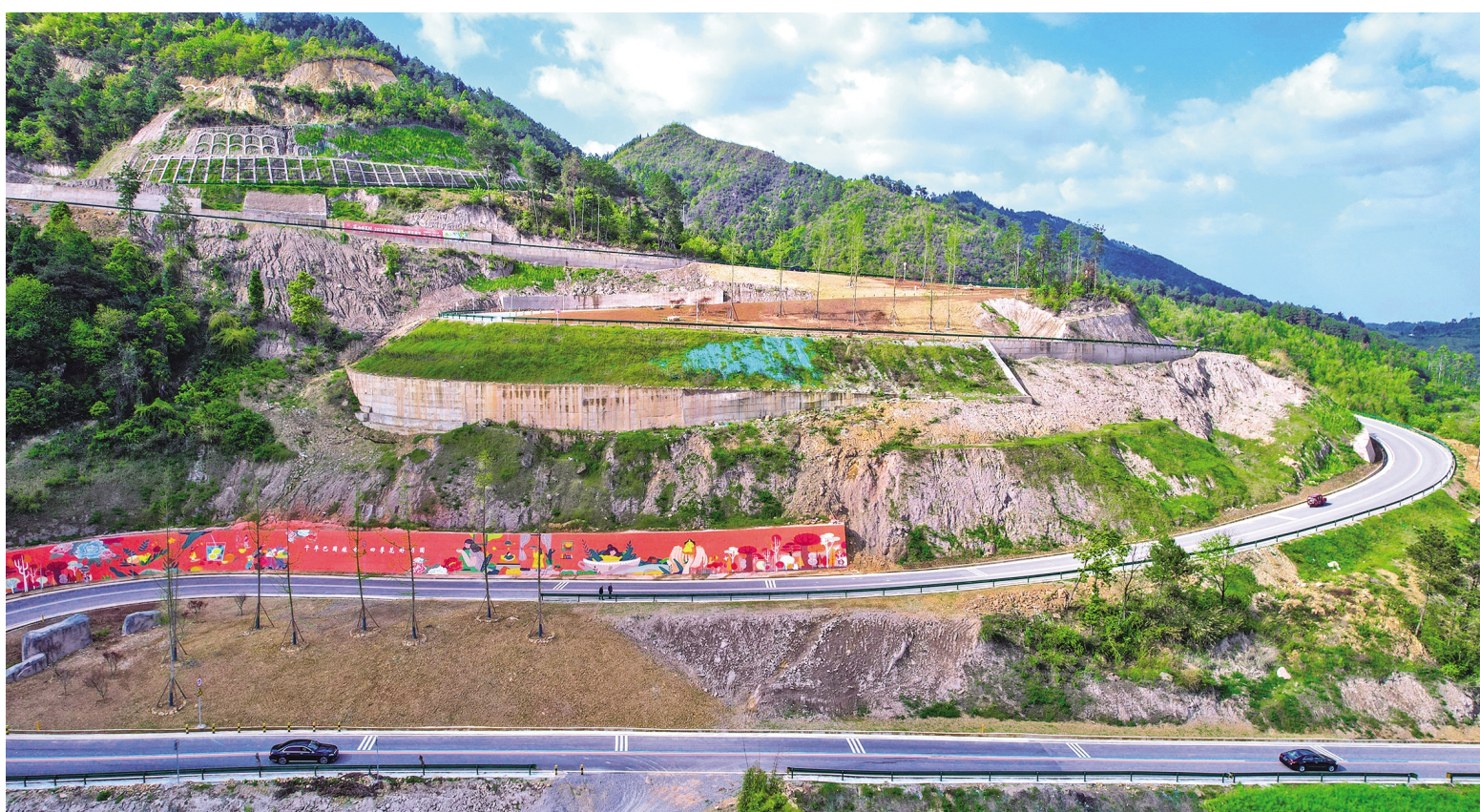
明月山天香路