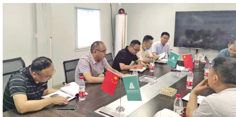
检查组对在建项目内业资料进行检查

该单位负责人表示，将始终做到“学纪、知纪、明纪、守纪”，依托专业技能和科学管理，推动安全生产各项措施的落地生根，为构建安全生产长效机制、促进社会繁荣和谐贡献国企力量。