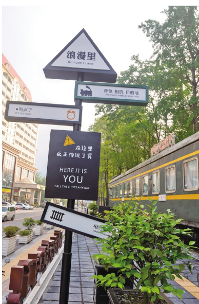
花水湾温泉小镇浪漫里标识标牌