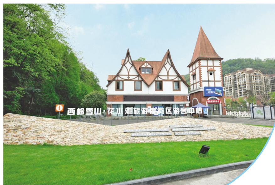
花水湾温泉小镇游客中心