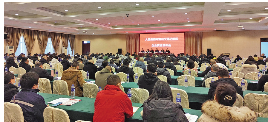
管委会召开企业安全培训会

前，协调解决巴德富农民工工资发放等纠纷4件、申报入学47人，举办3场招聘会共招聘1639人。“园区+局长”全面提供双保险服务。结合“局长进园区”工作机制，与企业负责人近距离接触、面对面交流，使企业“烦恼”事件有着落，事事有回音。截至目前，已联合县规自局、县住建局、县生态环境局局长开展3期“局长进园区”专题会，解决企业问题10余件，增