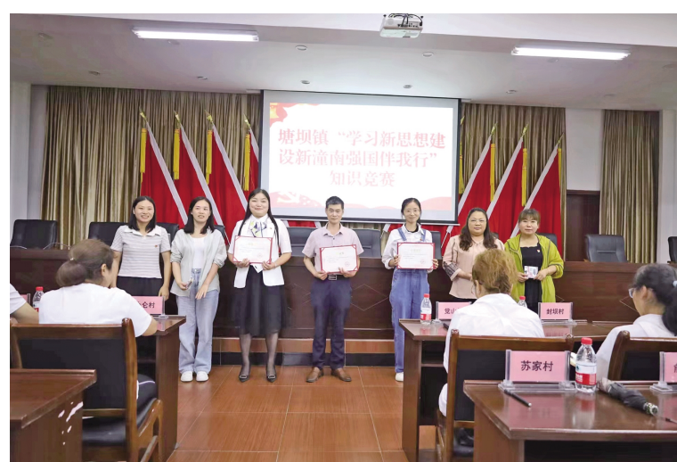
塘坝镇“学习新思想、建设新潼南、强国伴我行”知识竞赛

同时,抓实抓细“双网共治”,因地制宜建好“一中心四板块”,组建“潼心共治”网格群64个,配强“1+6+N”网格员人员148名,发挥网格作用解决群众问题2907个。创新探索“网格化+数字化+多元化+一体化”治理乡村,15个村推广使用“渝益农”“小院家”积分管理APP,整合