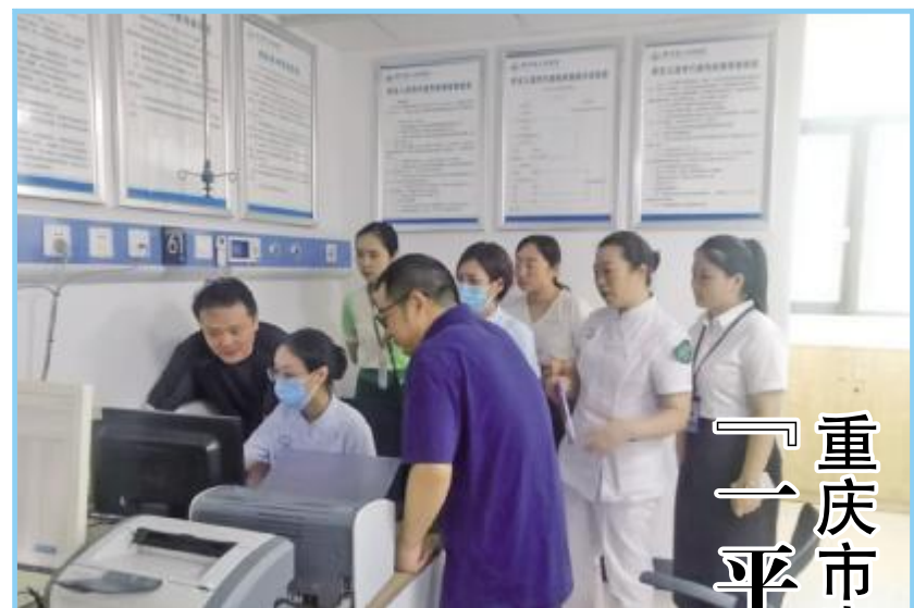
重庆市妇幼保健院及万州区妇幼保健院新筛中心专家一行对奉节县人民医院新生儿疾病筛查工作进行调研