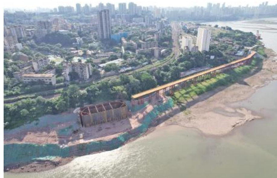
建设中的黄桷坪长江大桥

力促房地产市场领域回暖复苏。“恒大系”两个项目 4615 户交付销号，“恒大系”两个项目全面复工。用好用活“29+15”促进房地产市场发展系列政策，试点实施商品房团购等市场扩围举措，深研细究市里正在制定的棚改、危旧改、存量房网签等政策，抢占政策先机，加快推进房票制度。定期组织银政企对接活动，支持华润、万科等