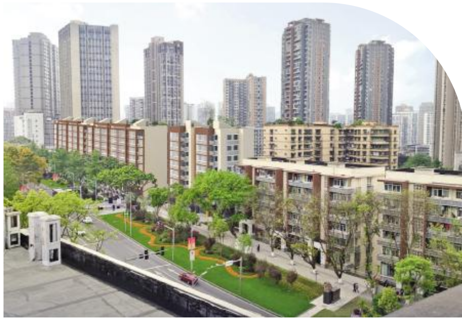
渝州路老旧小区改造