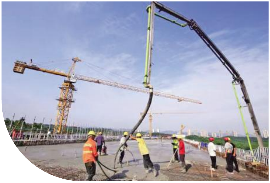
陶家隧道建设现场