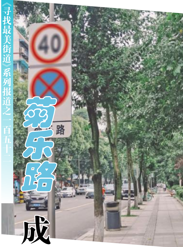
寻找最美街道系列报道之一百五十一