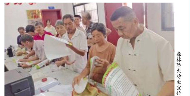
森林防火防虫宣传

据介绍,近年来,塘坝镇人大探索建立毗邻区域联动工作机制,加强川渝毗邻区协作,常态化开展跨省跨镇沟通合作。与护龙、新胜等镇开展联合巡林巡河,建立四川安岳岳岳护龙镇、潼南区塘坝镇林长制合作组织体