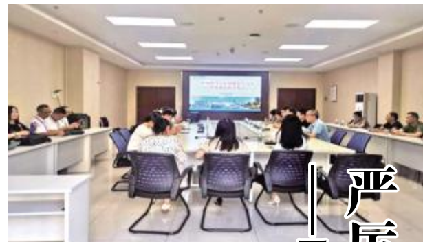
□蒋媛媛 本报记者 蒋永飞文/图

会议指出,平台建设要契合各省实际,因地制宜,切实提升平台适用性;各方要按照确定的平台定位和工程边界,兼顾标准统一、安全性、易操作性和可扩展性,统筹推进平台建设,确保数据共享交换通畅,数据安全得到保障;要强化成果转化,各方要按照分工,同心协力,争取早日建成平台,共同画好区域执法联动“同心圆”。